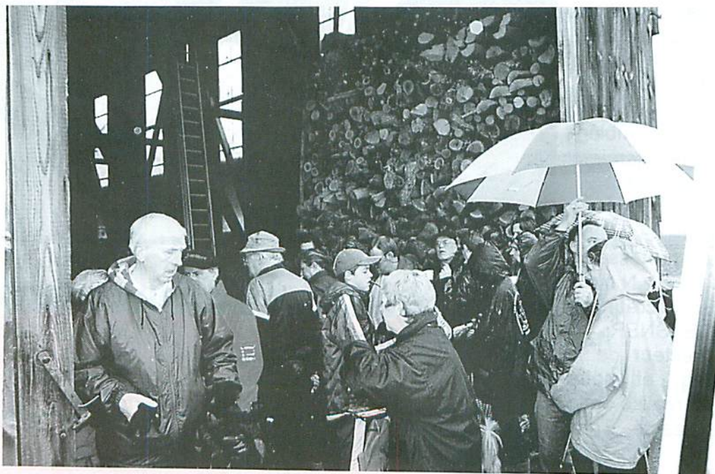
Un des relais d'accueil